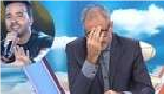
Jorge Rial destrozó a Luis Fonsi tras su paso por "ShowMatch"