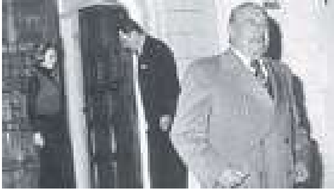
La culpa es de nuestra generación