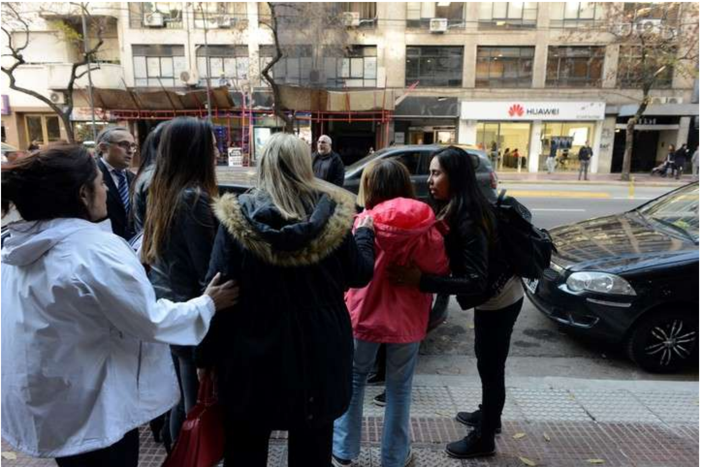
Las chicas, cuando partieron a los Estados Unidos para vivir con su padre.