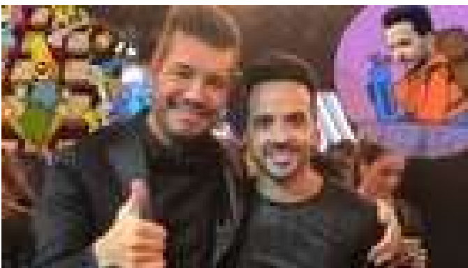
Luis Fonsi en "ShowMatch": los memes más divertidos de su participación

Luis Fonsi sufrió una dura historia de bullying antes de conocer el éxito