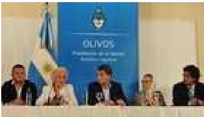
El Gobierno cruzó a Estela de Carlotto por comparar a Macri con Videla: "Bordea lo antidemocrático"