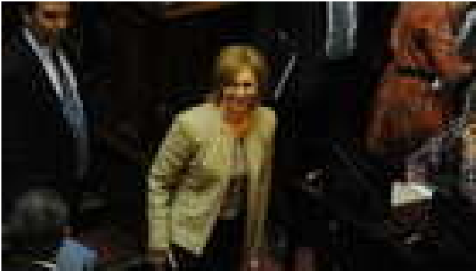
La madre del borrego