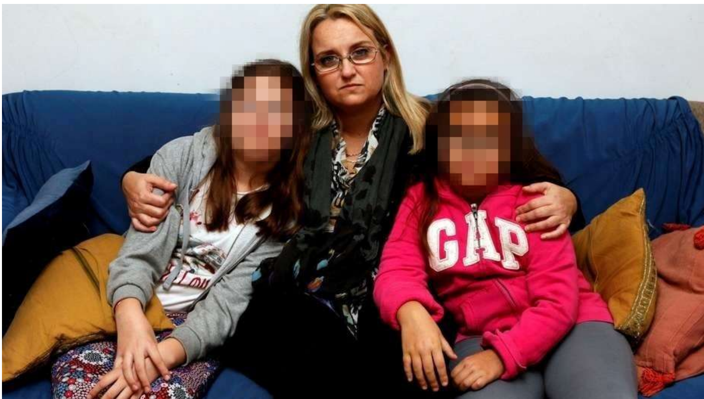
Las chicas con la mamá, quien dijo que va a apelar la sentencia. .

Es el caso de las chicas que tuvieron que ir a vivir con su padre a los Estados Unidos. El juez dice que hay contradicciones en el testimonio de abuela de la nena, quien había hecho la denuncia.